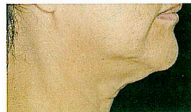
Thermage Kinn: Vorher