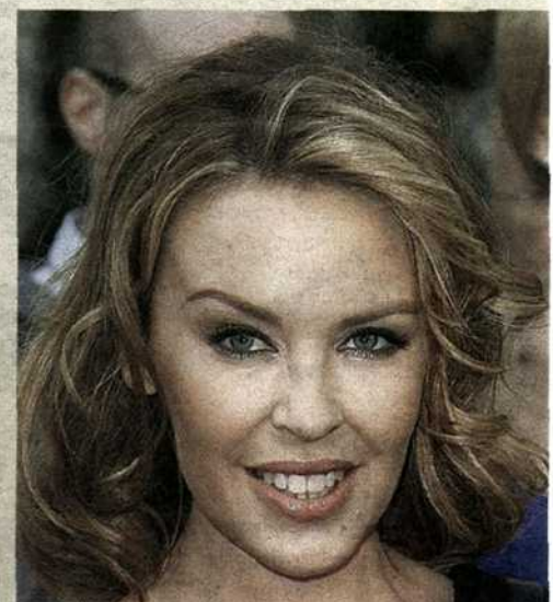
Madonna: Natürlich altern sähe anders aus